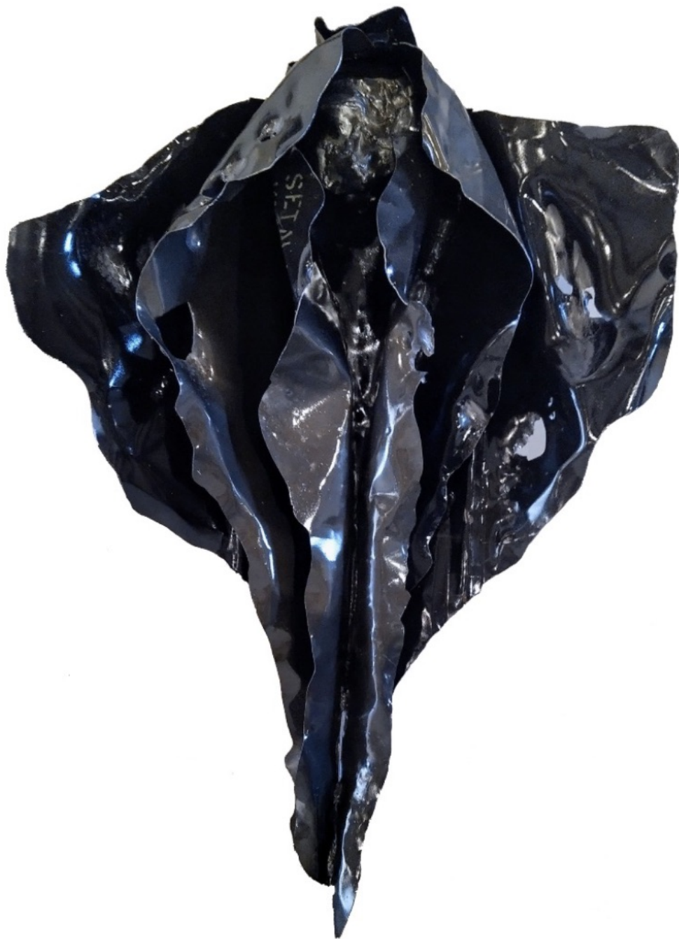
Abdul Rahman Katanani, Vulvae , 2020, environ 150 x 100 cm, tôle